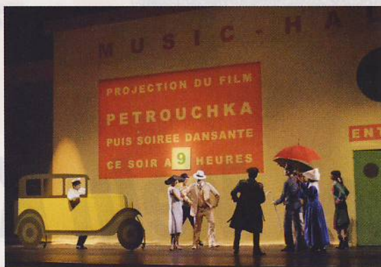
Petroouchka de Benjamin Millepied